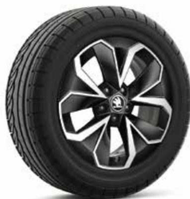
16" HOEDUS Aero kotači od lakog metala, crna, polirani