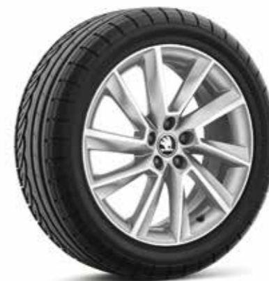
17" STRATOS kotači od lakog metala