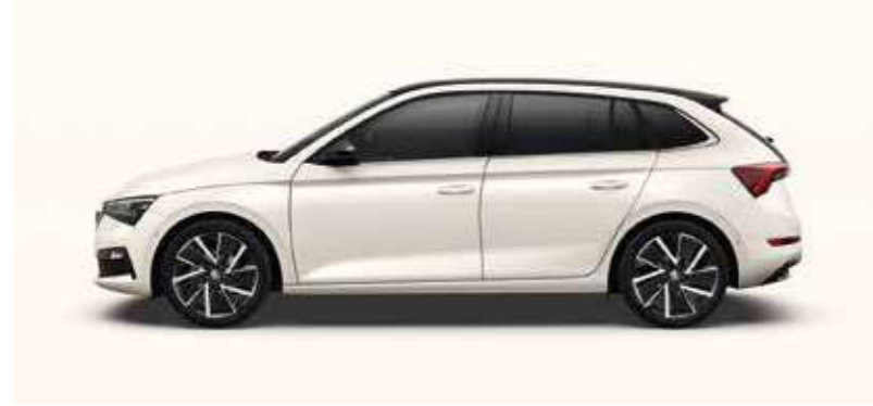
CANDY BIJELA UNI