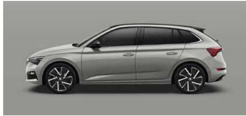
STEEL SIVA UNI