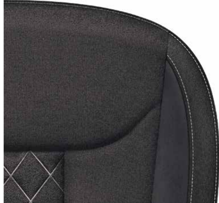
Sportska sjedala Ambition/Style (tkanina/Suedia)