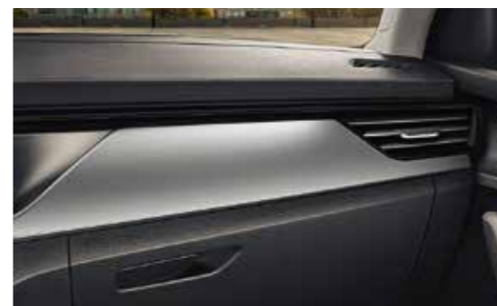
SREBRNI HAPTIČKI DEKORATIVNI ELEMENTI / CRNI „HOTSTAMPING“ (za varijantu opreme Ambition)