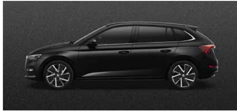
MAGIC CRNA METALIK