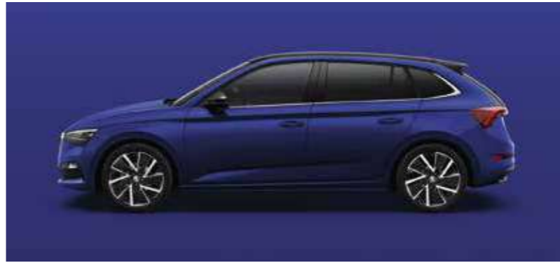
ENERGY PLAVA UNI