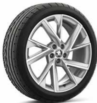
18" VEGA kotači od lakog metala