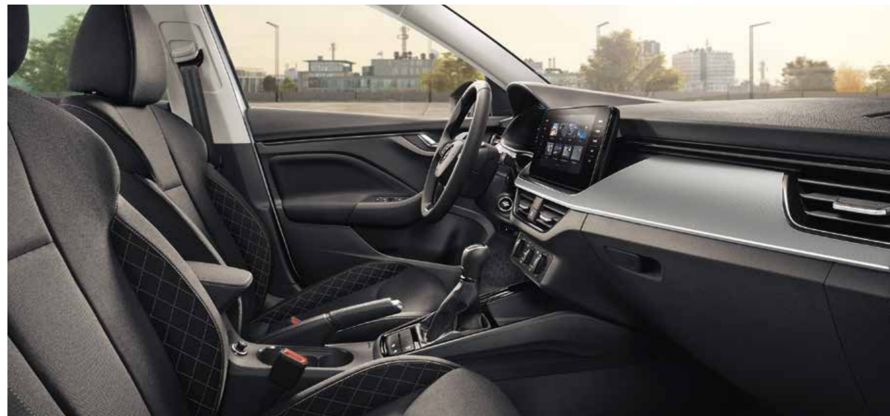
UNUTRAŠNJOST AMBITION CRNA Presvlake od tkanine