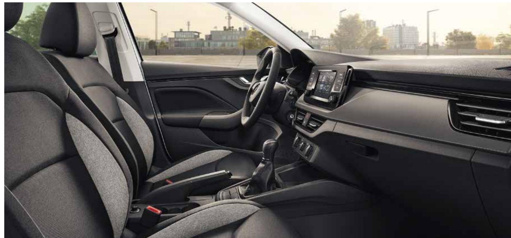
UNUTRAŠNJOST ACTIVE CRNA Preslake od tkanine