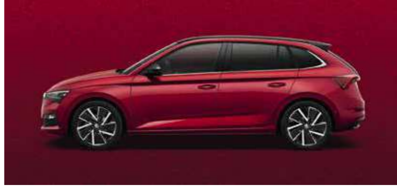
VELVET CRVENA METALIK