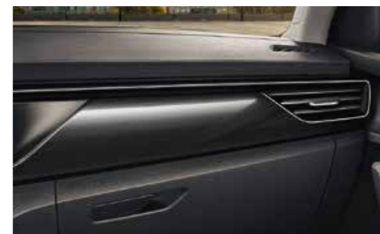
CRNI TOČKASTI DEKORATIVNI ELEMENTI / KROMIRANI „HOTSTAMPING“ (za varijantu opreme Style)