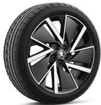
18" VEGA Aero kotači od lakog metala, crna, polirani