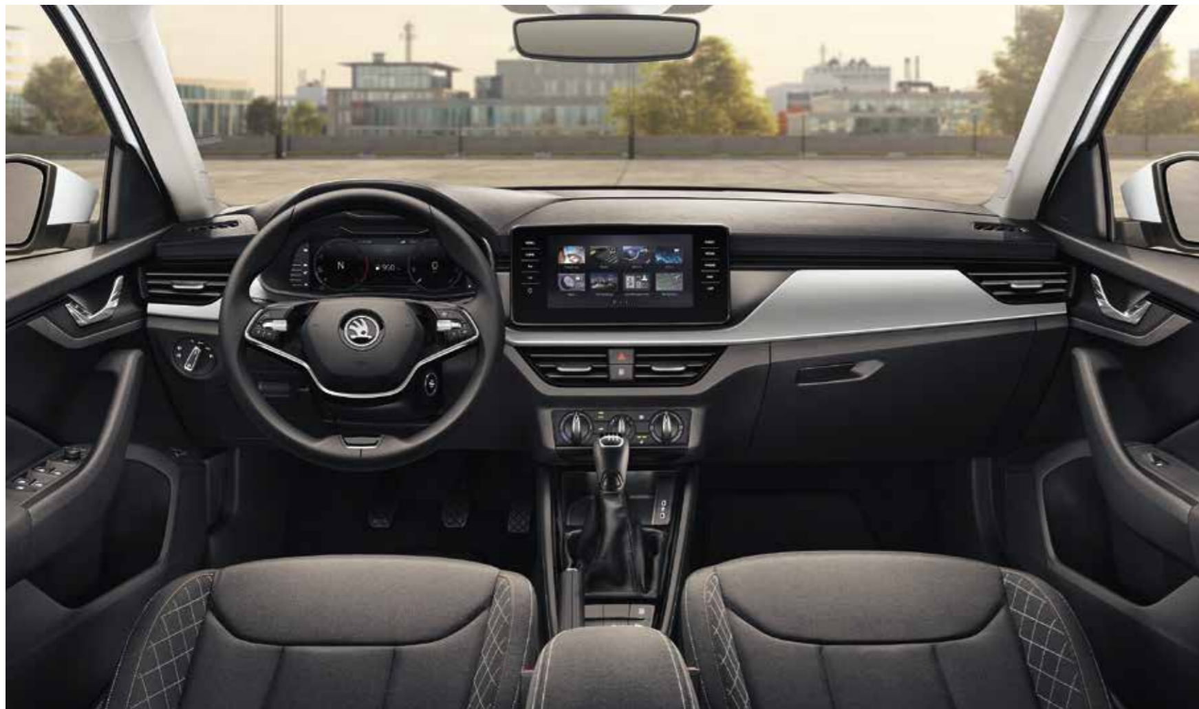
UNUTRAŠNJOST AMBITION CRNA Presvlake od tkanine