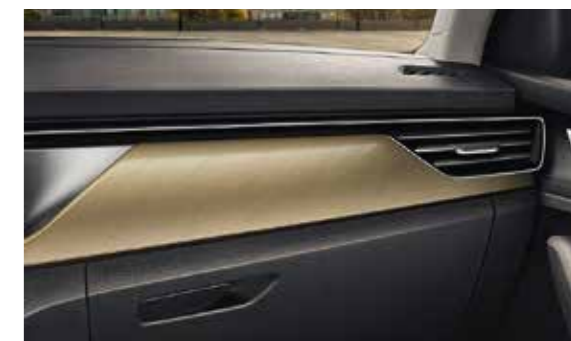
BAKRENI ČETKANI DEKORATIVNI ELEMENTI / KROMIRANI „HOTSTAMPING“