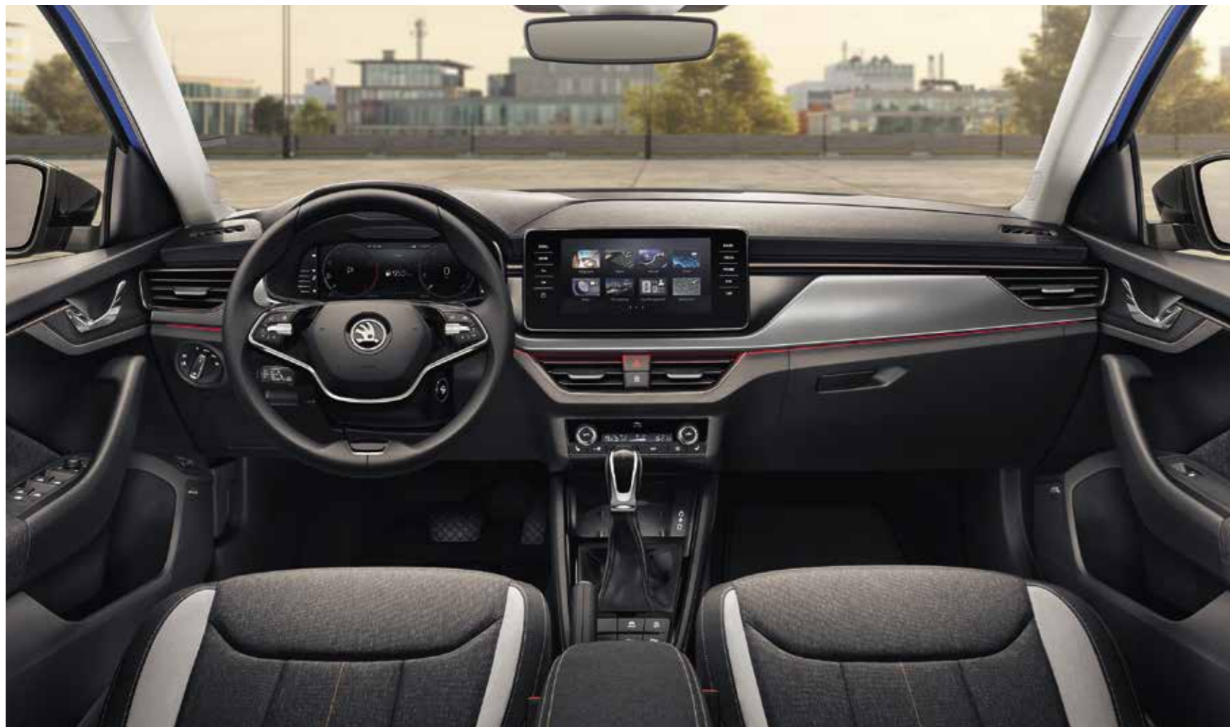
UNUTRAŠNJOST STYLE CRNA Presvlake od Satin/Suedia