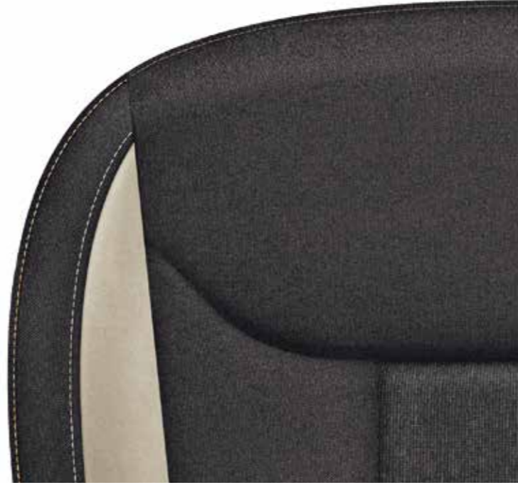
Style bež (Satin/Suedia)