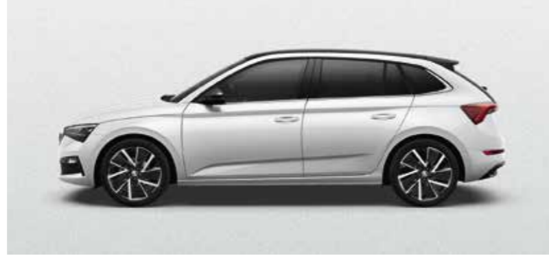
MOON BIJELA METALIK