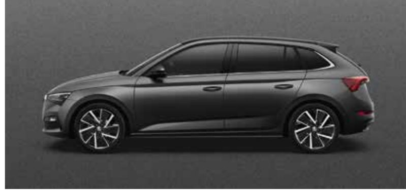
GRAPHITE SIVA METALIK