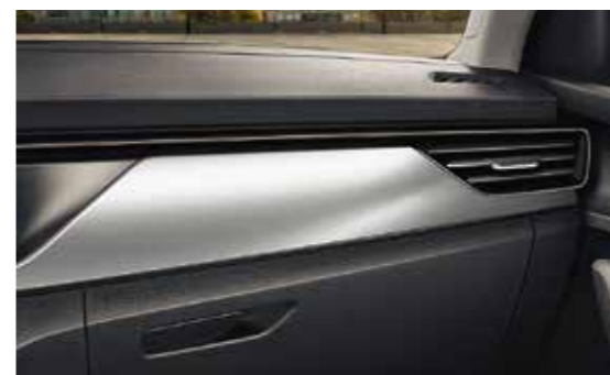
SIVI LATTICE DEKORATIVNI ELEMENTI / BAKRENI „HOTSTAMPING“