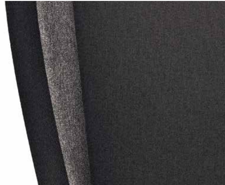
Active crna (tkanina)