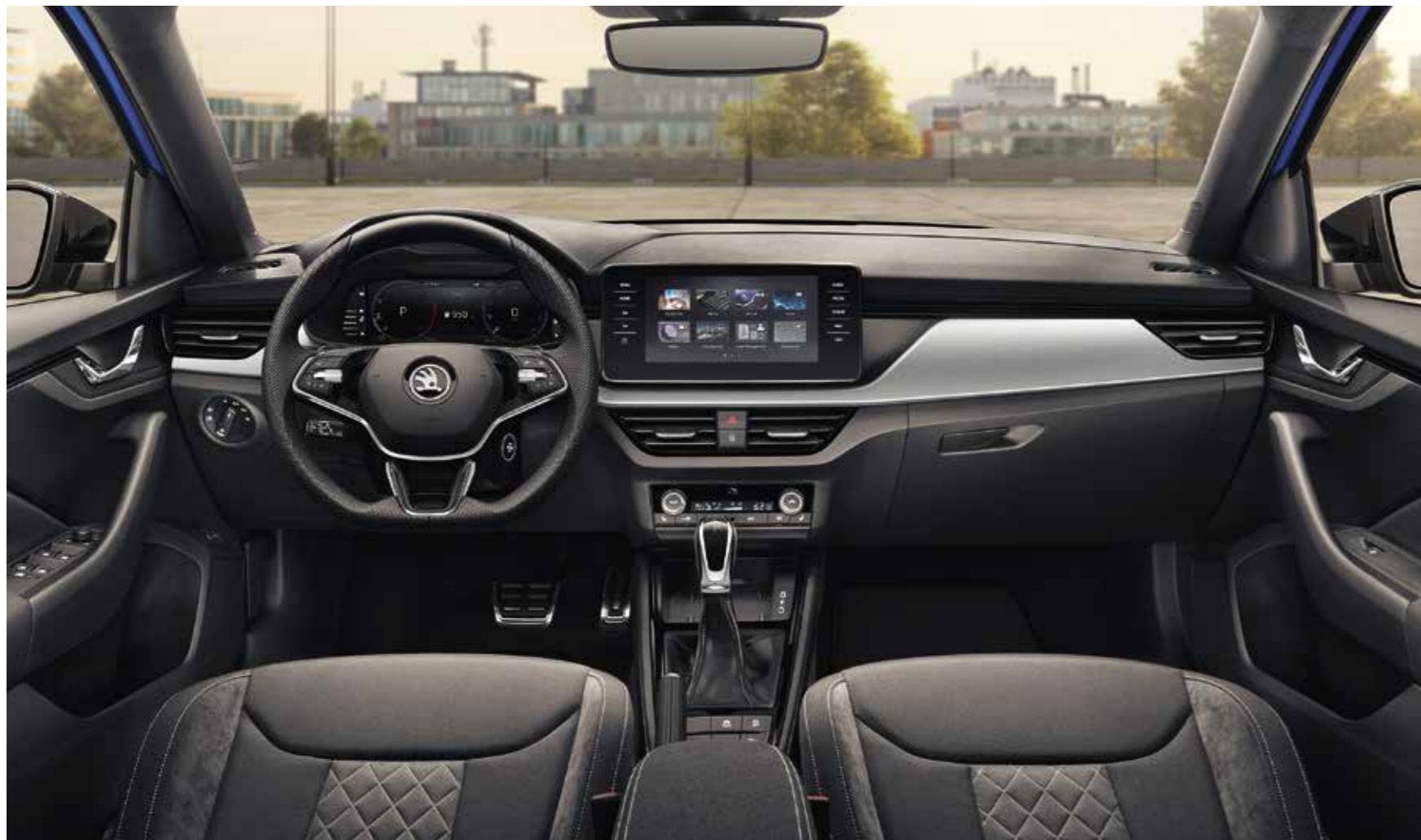
UNUTRAŠNJOST DYNAMIC Presvlake od tkanine/Suedia

Paket Dynamic, koji je za varijante opreme Ambition i Style dostupan kao dodatna oprema, obuhvaća sportska sjedala, višenamjensko sportsko kolo upravljača, obloge papučica od plemenitog čelika i crnu krovnu oblogu.