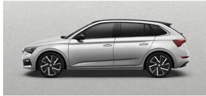
BRILLIANT SREBRNA METALIK