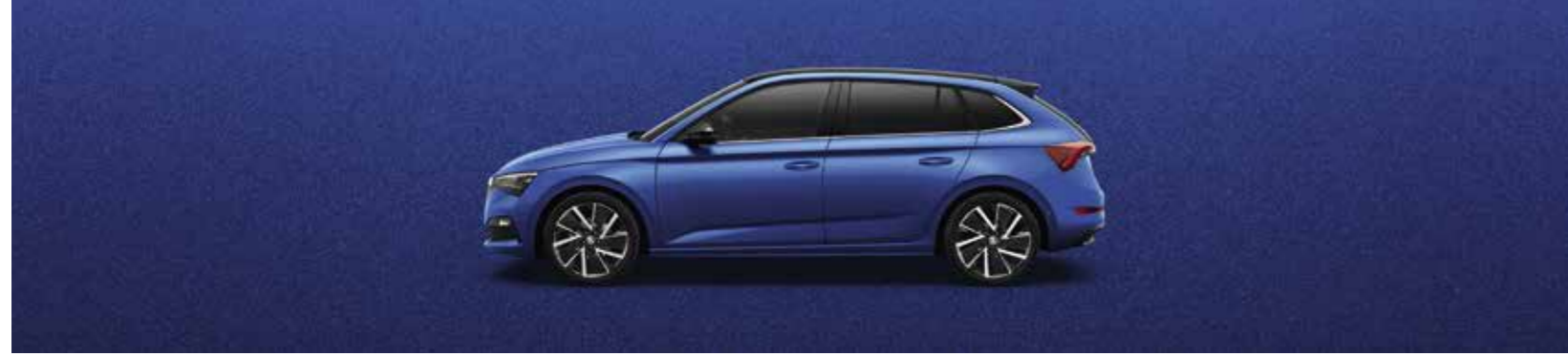
RACE PLAVA METALIK