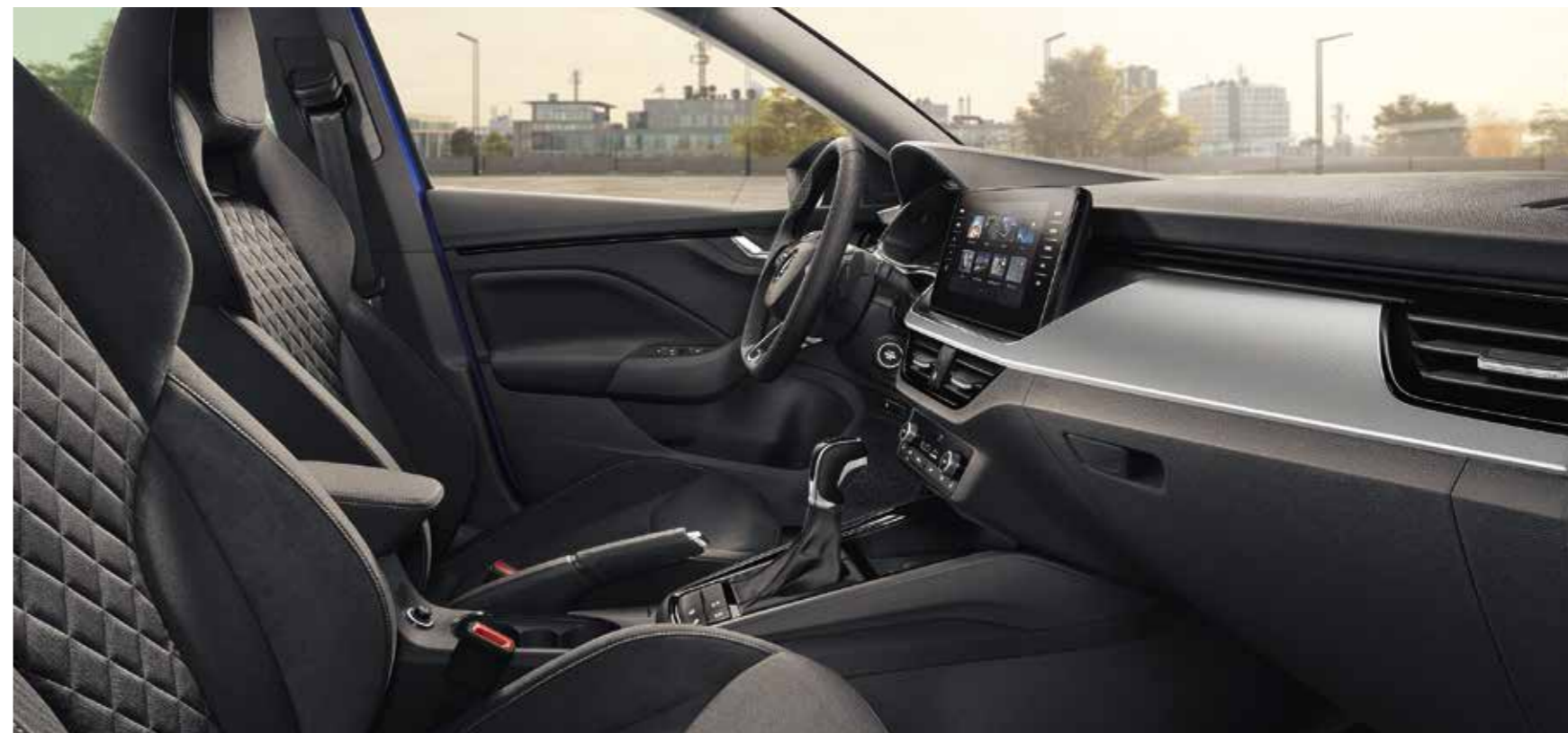
UNUTRAŠNJOST DYNAMIC Presvlake od tkanine/Suedia