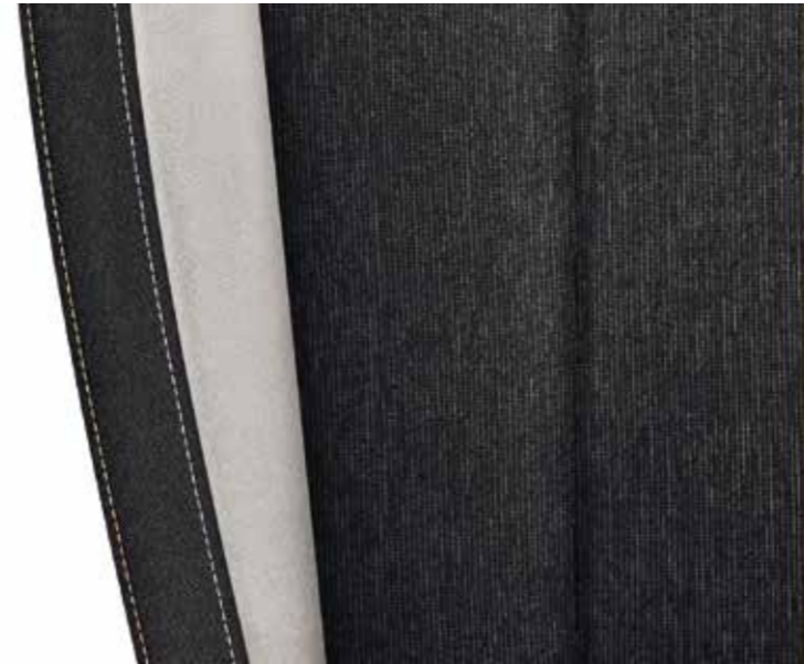
Style crna (Satin/Suedia)