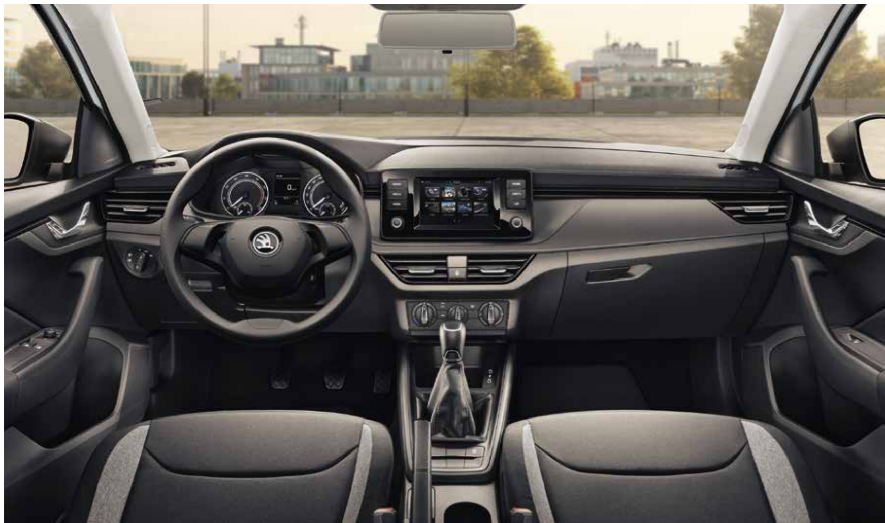
UNUTRAŠNJOST ACTIVE CRNA Preslake od tkanine