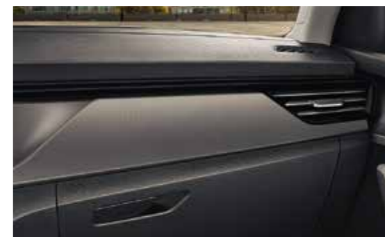
CRNI DEKORATIVNI UMETAK / CRNI „HOTSTAMPING“