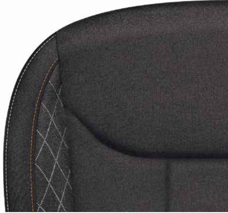
Ambition crna (tkanina)