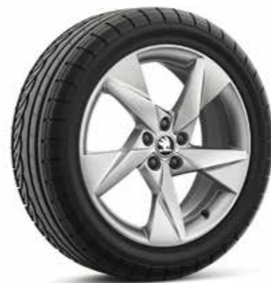
17" VOLANS kotači od lakog metala