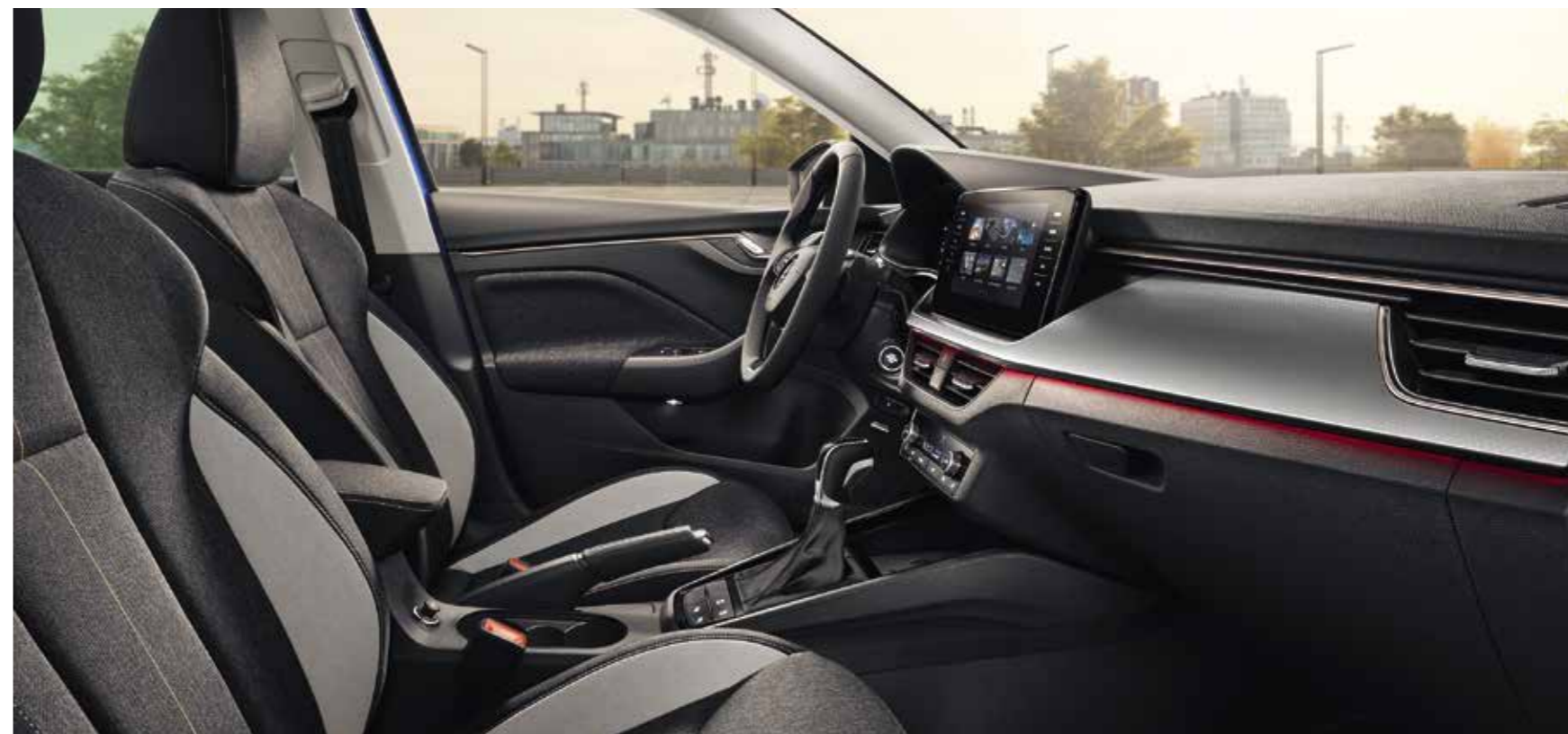
UNUTRAŠNJOST STYLE CRNA Presvlake od Satin/Suedia