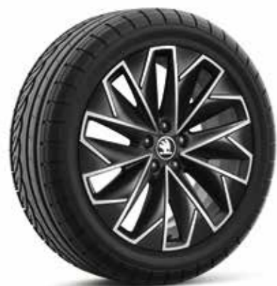
17" PROPUS Aero kotači od lakog metala, crna/srebrna, polirani